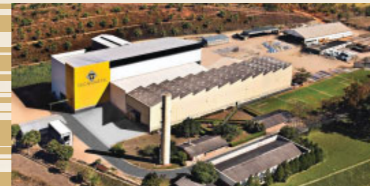
Vista aérea - Tecnometal Engenharia Vespasiano - MG Aerial View - Tecnometal Engenharia

Tecnometal Engenharia e Construções Mecânicas Ltda. Av. das Nações, 3.801 – Distrito Industrial CEP: 33200-000 – Vespasiano – MG – Brasil Tel.: (55 31) 2122-2400 – Fax: (55 31) 2122-2430 comercial@tecnometal.com.br