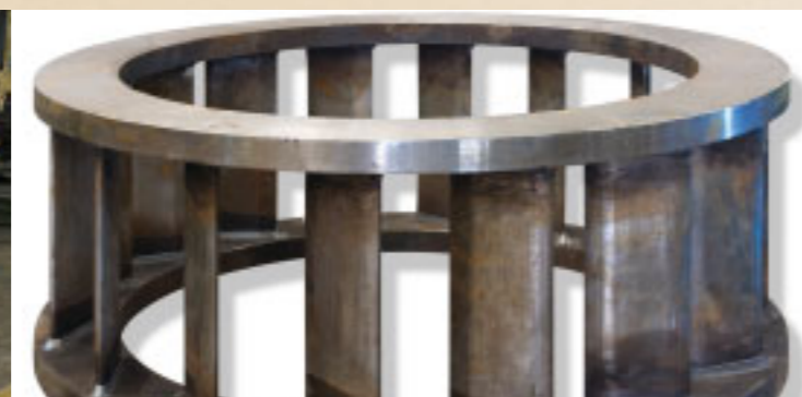
Pré-distribuidor de turbina hidráulica Energ Power - Usina Salto Buriti - GO Stay ring for hydraulic turbine