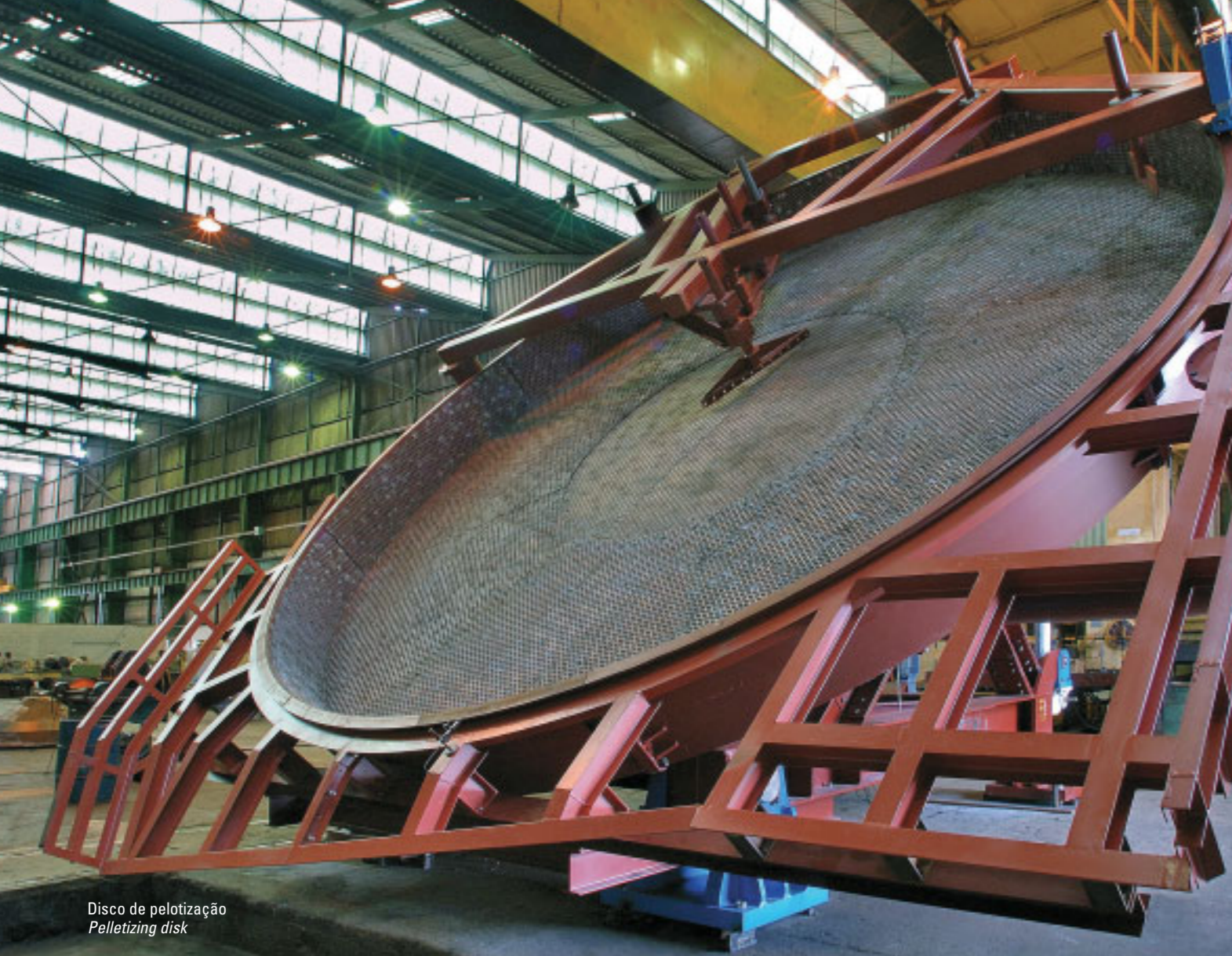
Disco de pelotização Pelletizing disk