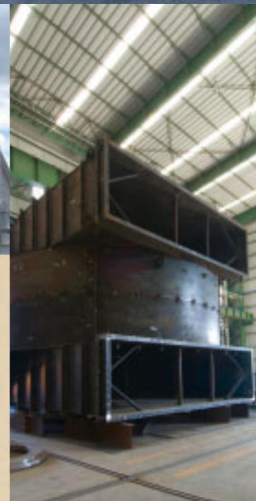
Carcaça de ventilador Spiral box for fanning