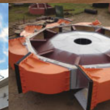
Roda de caçamba CVRD - ES Bucket wheel