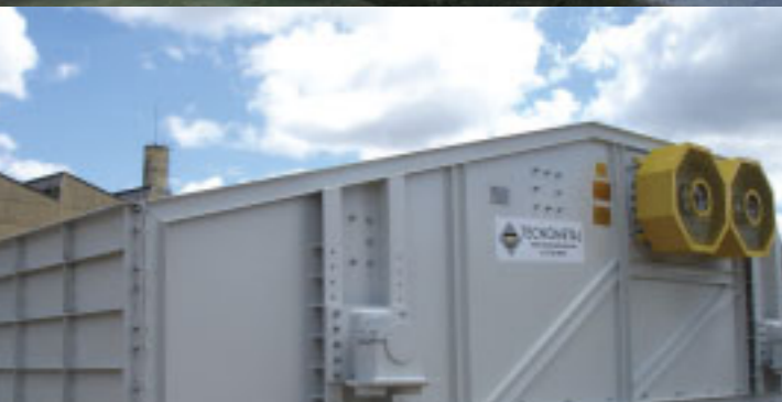
Peneira Vibratória MBR - MG Vibrating screen