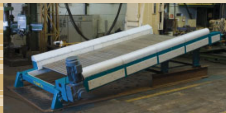
Peneira de rolos Samarco - ES Roller screen