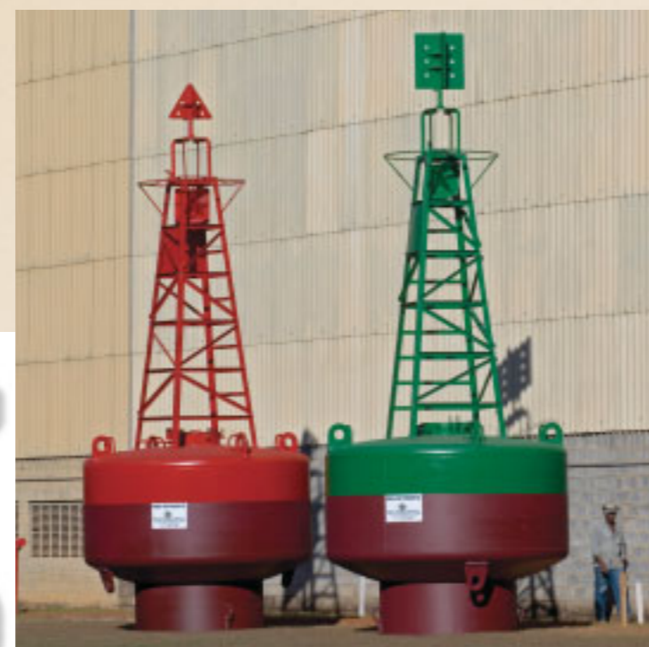
Bóias de sinalização náutica CVRD - MA Signalling nautical float