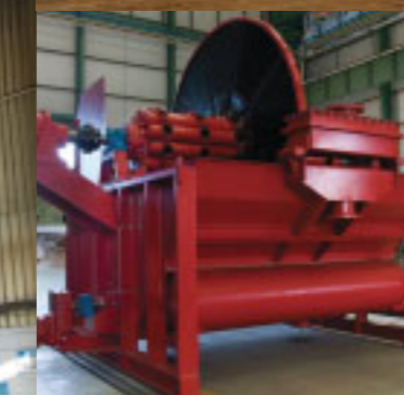
Filtro a vácuo Vacuum filter