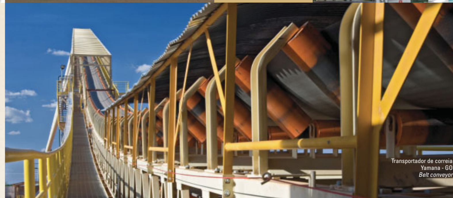
Transportador de correia Yamana - GO Belt conveyor