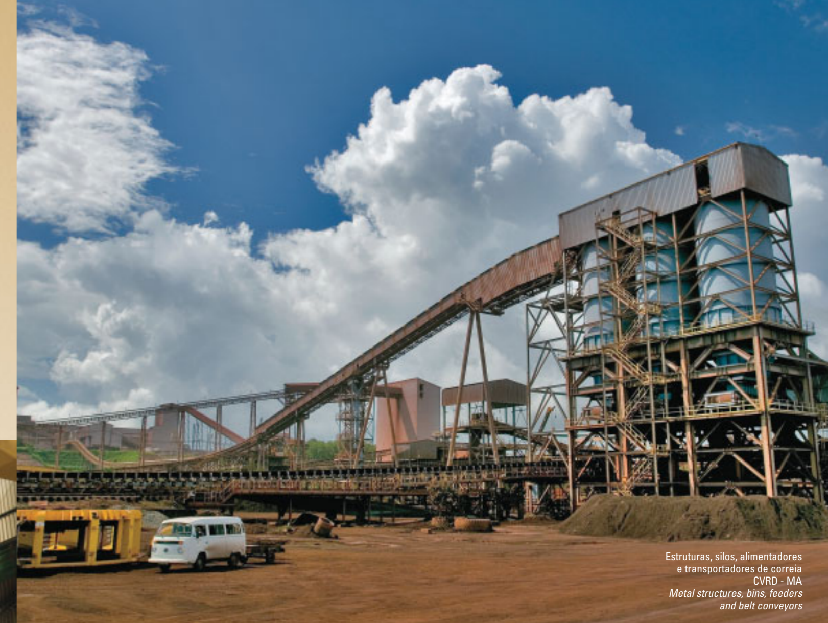
Estruturas, silos, alimentadores e transportadores de correia CVRD - MA Metal structures, bins, feeders and belt conveyors