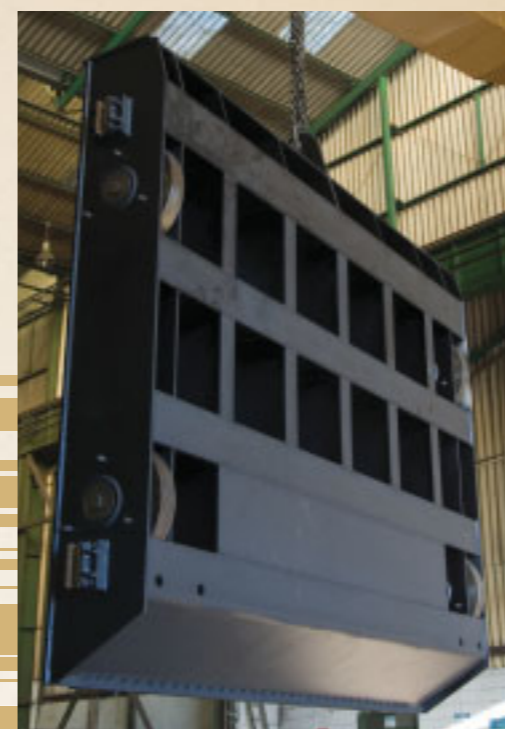
Comporta vagão Energ Power - República Dominicana Gate